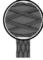
Zárt kábelbehúzó harisnya, 1 horgos

Egy vagy több kábel egyidejű behúzására alkalmas harisnyák. A kábelkötegek megfelelő méretű harisnya kiválasztása nagyon fontos!