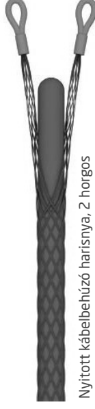
Nyitott kábelbehúzó harisnya, 2 horgos